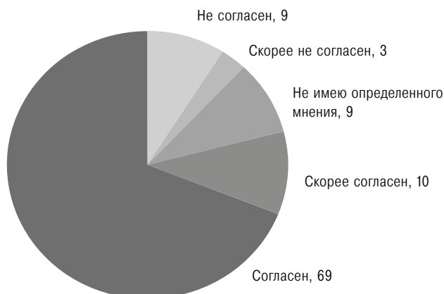
Рис. 1. Вопрос: Согласны ли вы с утверждением «Родители обсуждают вместе с учителями успехи своего ребенка и его трудности в учебе»?», % ответивших (N = 3084)